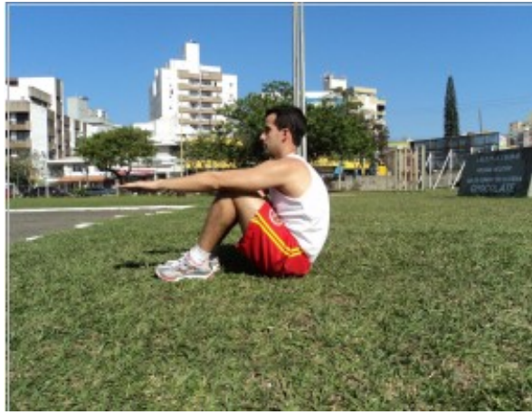
Foto 15: Posição Inicial e Final ( Posição “Um”) - Visão Lateral Foto 16: Posição “Dois” - Visão Lateral